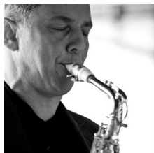
Florian Bramböck © Privat