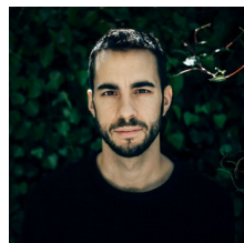
Manu Delago © Lorenz