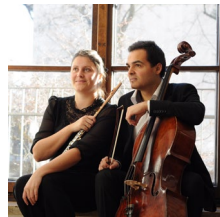
Duo CORDEOLE © Purvi-Joshi