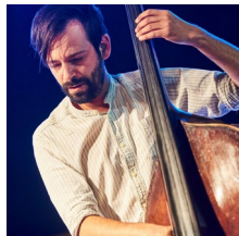
Klaus Telfser © N.G.Gerenčir