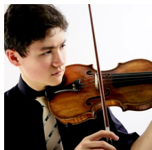
Erik Mayr