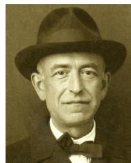
Manuel de Falla