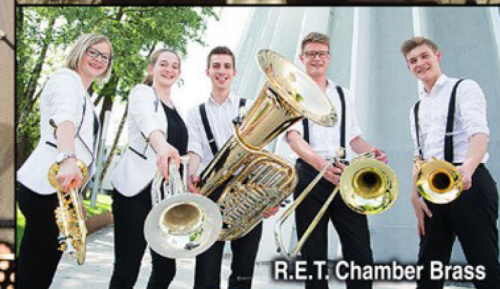
R.E.T. Chamber Brass